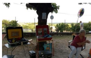
Pique-nique de la Chouette

Vie du village: des festivités bienvenues après les confinements