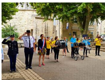
Cérémonie du 14 juillet