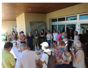
Journée des associations