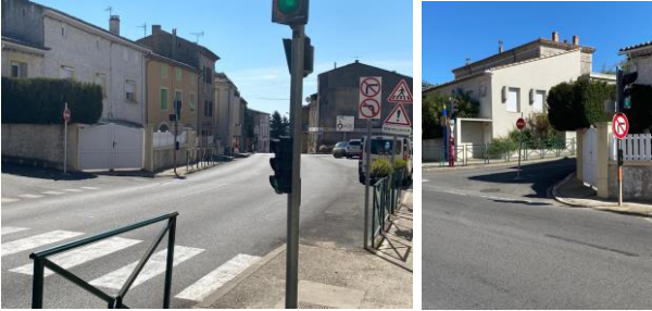
Sens unique pour accès à l'école publique