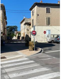
Signalétique Rue des 2 Tours