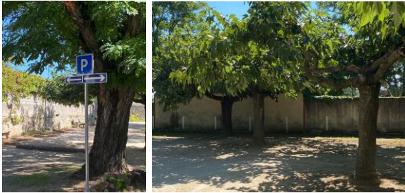
Marquage des espaces jeu de boules et parking