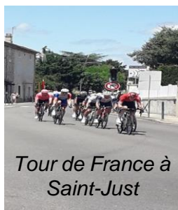
Tour de France à Saint-Just

Avec la gendarmerie pour la signature du protocole avec le parquet pour la sécurité des habitants