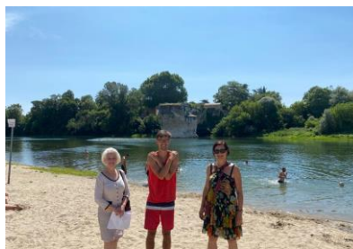
Surveillance de la Plage du Pont-Cassé malgré notre manque de budget

Remise des calculatrices aux CM2 des écoles publique et privée