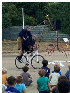
Jour de cirque: la Cascade dans la cour de l'école

Visite du vieux village pour les journées du patrimoine